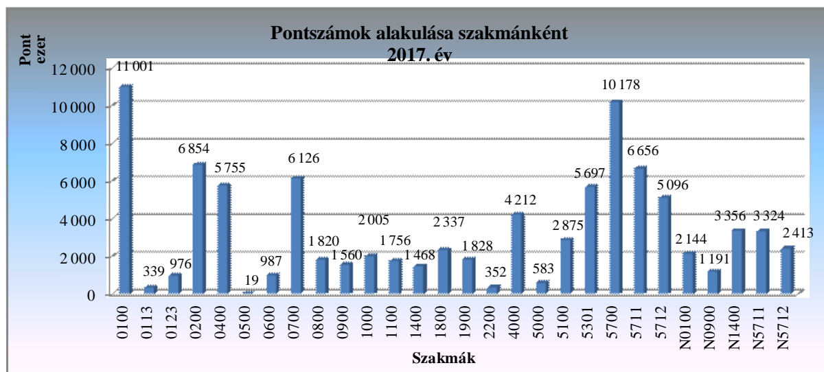
3. diagram: Pontszámok