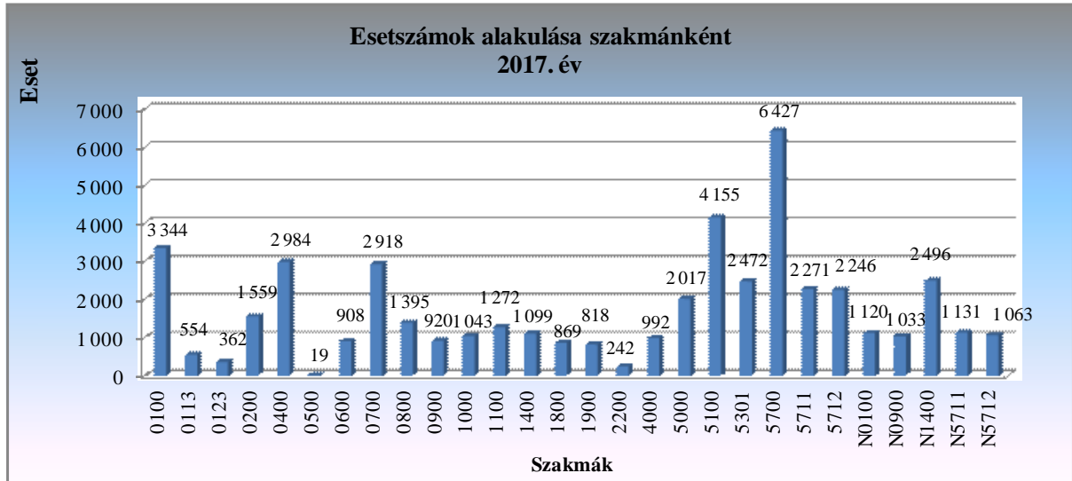
1. diagram: Esetszámok

Az Intézményi teljesítmény alakulásának szemléltetése 2017. évben: